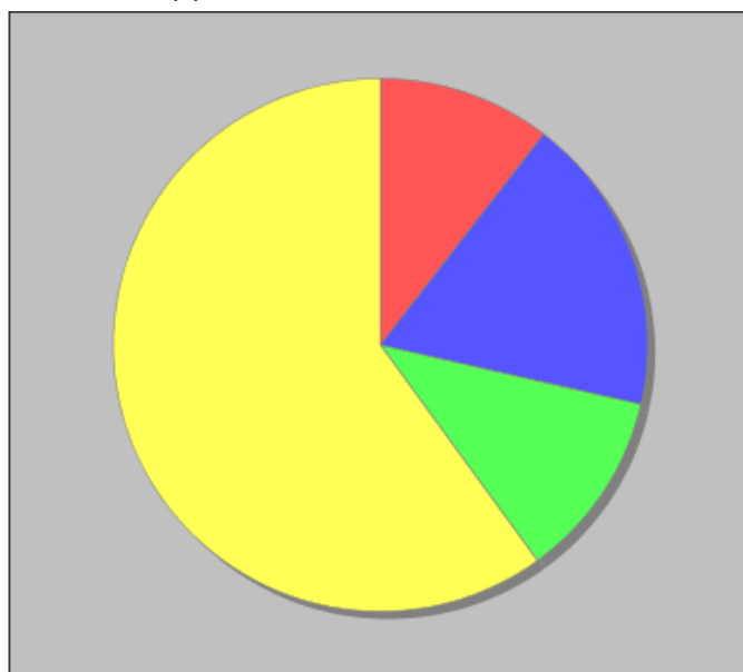
Distribuzione dei docenti a T.I. per anzianità nel ruolo di appartenenza (riferita all'ultimo ruolo)